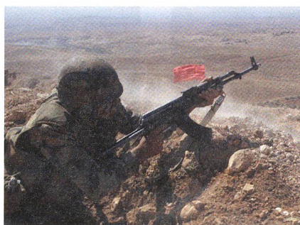
Infanteriekämpfer am Berg Hermon.