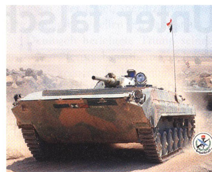
Seit dem Eingreifen der russischen Luftwaffe verstärkt Russland die angeschlagene Asad-Armee: Zwei BMP-1.

Der Sprecher der Luftwaffe liess an der israelischen Vergeltungsstrategie nicht den geringsten Zweifel offen: «Israel toleriert kein Überschwappen des Bürgerkriegs auf sein Territorium. Israel macht das syrische Regime für alle Übergriffe unmittelbar verantwortlich.» Aussenminister Lieberman nannte den syrischen Feuerüberfall explizit beabsichtigt. fo.