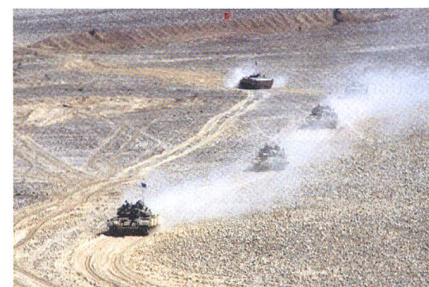
Drei alte T-55-Panzer und zwei BMP-1.