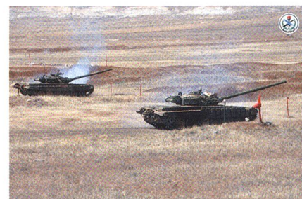
Zwei Kampfpanzer T-72AV = T-82.