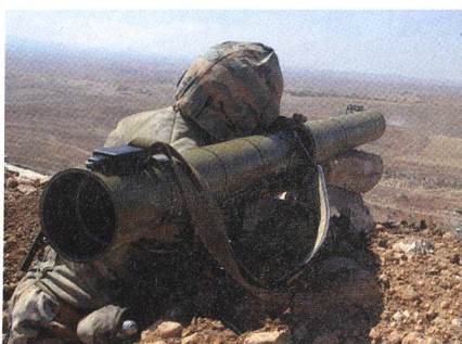
Panzerabwehr: Infanterist mit RPG-29.