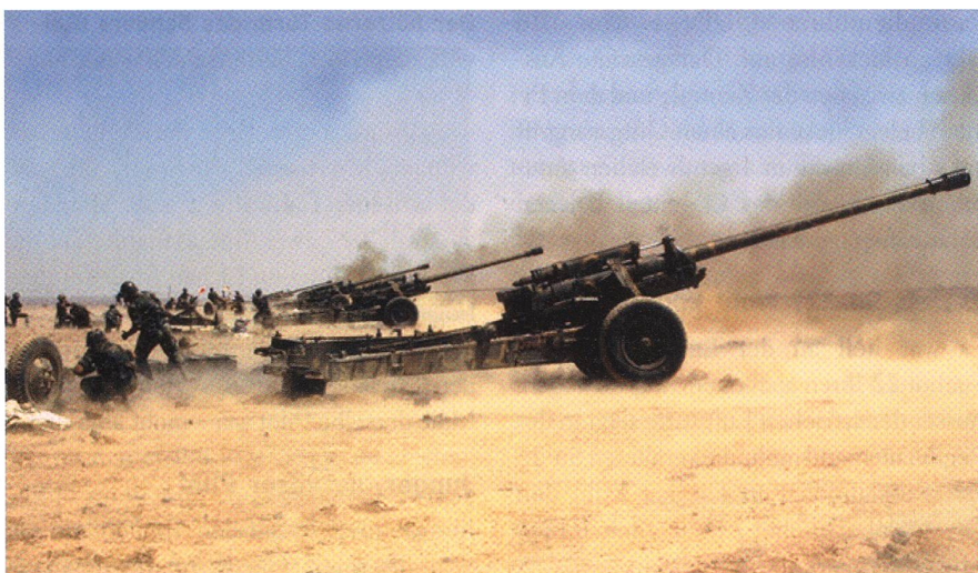
Syrische M-46-Batterie. Drei solche 130-mm-Einheiten wurden von Israel zerstört.

Wie israelische Quellen mitteilen, zerstörte am 21. Oktober 2017 die israelische Luftwaffe drei syrische M-46-Batterien im Golan-Vorfeld. Die weitreichenden syrischen 130-mm-Kanonen hatten bei einem Feuerüberfall die israelischen Golan-Orte Katzrin, Givat Yoev, Geshur, Kfar Horev, Mevo Hama, Meitzar, Neot Golan, Nov and Ramat Magshimim heftig getroffen.