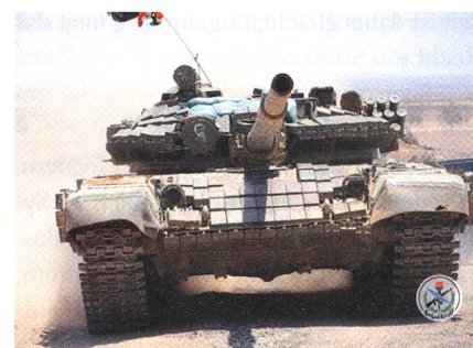
Der von Syrien T-82 genannte Panzer.