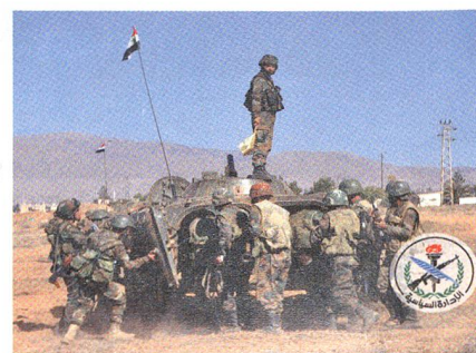
Syrer chinesisch gerüstet: Weste, Helm.