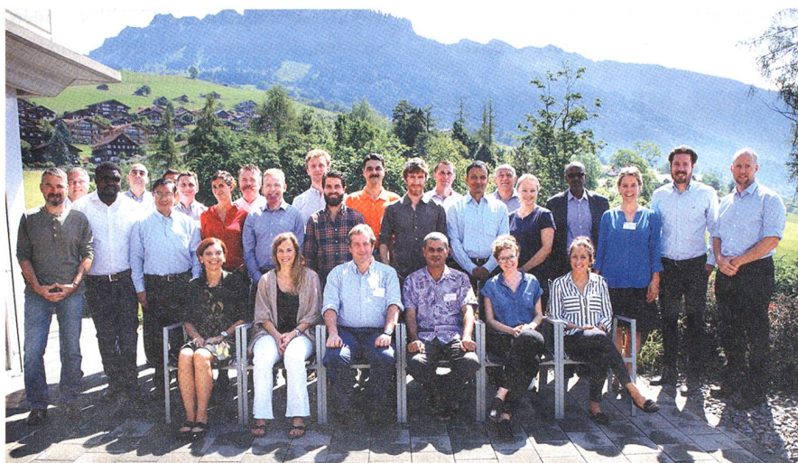
Die Teilnehmer des Kurses zur Schulung der Zivil-Militärischen Koordination.