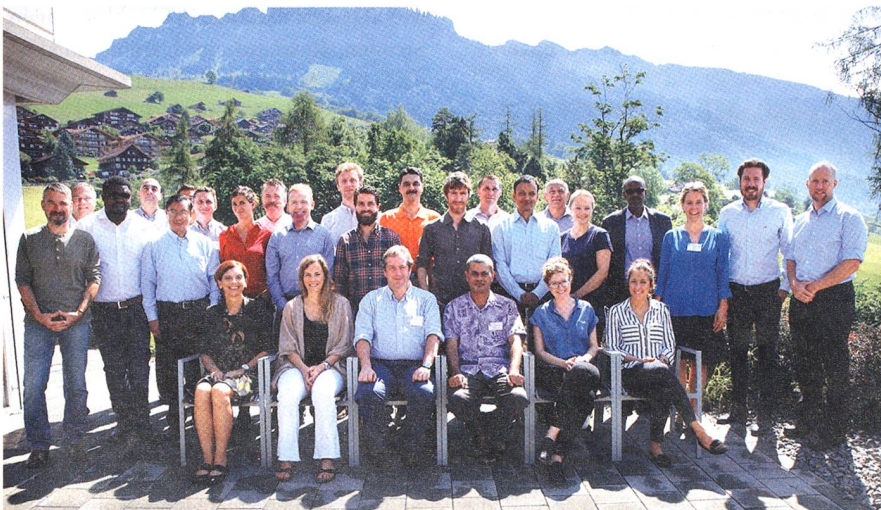
Die Teilnehmer des Kurses zur Schulung der Zivil-Militärischen Koordination.