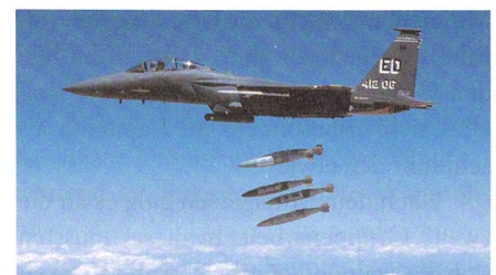
Abwurf von JDAM von einem F-15.