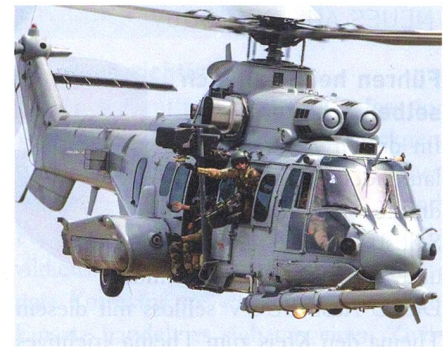
Zusätzliche H225M für Thailand.

Airbus Helicopters liefert der Luftwaffe Thailands bis 2021 vier weitere Mehrzweckhelikopter vom Typ H225M. Damit wird der Helikopterbestand auf zwölf Maschinen aufgestockt. Der Helikopter der 11-