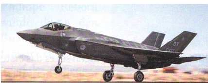
Belgien ist nächster F-35 Kunde.

Die belgische Regierung hat Ende Oktober bestätigt, dass sie sich für die F-35 und gegen Eurofighter und Rafale entschieden hat. Gekauft werden auch zwei SkyGuardian-Drohnen. Die Wahl der F-35 als Ersatz für die noch 52 F-16 war seit langem erwartet worden. Verteidigungsminister Steven Vandeput sagte auf einer Pressekonferenz: «Das Angebot der Amerikaner war in allen sieben Evaluationskriterien das Beste». Insbesondere lag der Preis mit 4,011 Milliar-