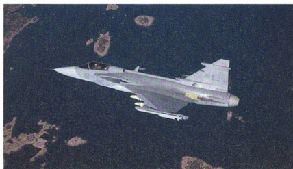
Gripen E-Prototyp mit IRIS-T.

Die Gripen E hat die ersten Versuche zum Abwurf von Aussenlasten beziehungsweise zum Start von Lenkwaffen durchgeführt. Sie fanden im Oktober über dem Testgelände Vidsel in Nordschweden statt. Der momentan noch einzige fliegende Proto-