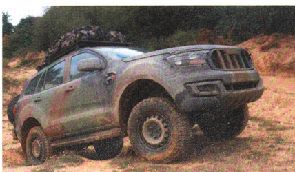
Neues Geländefahrzeug VT4.

Im ersten Los waren bereits 1000 Fahrzeuge bestellt worden, von denen die ersten noch in diesem Jahr ausgeliefert werden sollen. Der Gesamtbedarf liegt bei 4380 Fahrzeugen. Das VT4 wird von AC-MAT auf Basis des 4x4 Ford Everest hergestellt. Die Militarisierung umfasst u.a. Verbesserung der Geländegängigkeit, Vorrüstung für die Integration von Funkgeräten/Informationssystemen sowie die Ausstattung mit Waffenhalterungen.