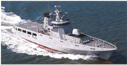
OPV 80-Klasse für Australien.

Die Fr. Lürssen Werft wurde von der australischen Regierung mit der Fertigung der nächsten Generation von Offshore Patrol