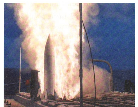
Testabschuss einer SM-6 gegen einen ballistischen Flugkörper.

Die drei Zerstörer der «Zumwalt»-Klasse (DDG-1000) werden mit dem Flugkörpersystem SM-6 als Hauptbewaffnung ausgerüstet um ihre neue Rolle als Offensive Surface Strike-Zerstörer erfüllen zu können. Der weitreichende Flugkörper SM-6 kann Luft-, See- und Landziele sowie Cruise-Missiles und ballistische Raketen in ihrer Endphase bekämpfen. Die U.S. Navy will in den kommenden fünf Jahren