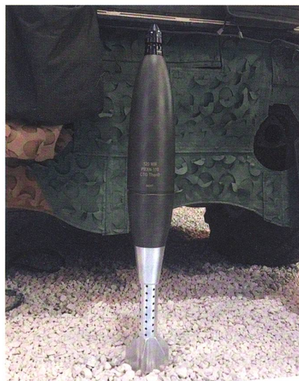
Neues Mörsergeschoss THOR von SBDS.

Der Auftrag umfasst die HE-Sprenggranate WG sowie die Sprenggranate EUG und möglicherweise das neueste Produkt von SBDS, nämlich die THOR – die neueste Version der vorfragmentierten Mörsergranaten. Bei vorfragmentierten Grana-