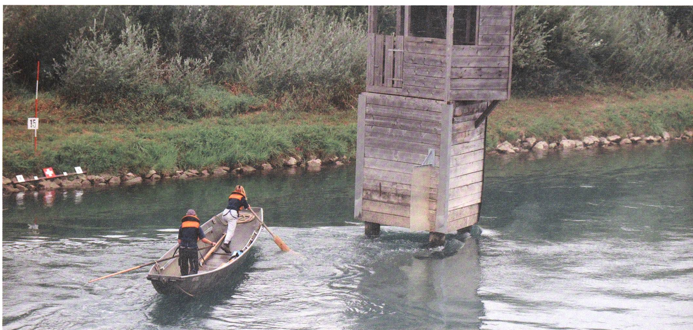
Die Jungpontioniere PSV Ligerz zeigen, was sie können.

Ganz bescheiden begann der SMSV 1983 mit dem jährlichen Ausbildungs- und Feri-