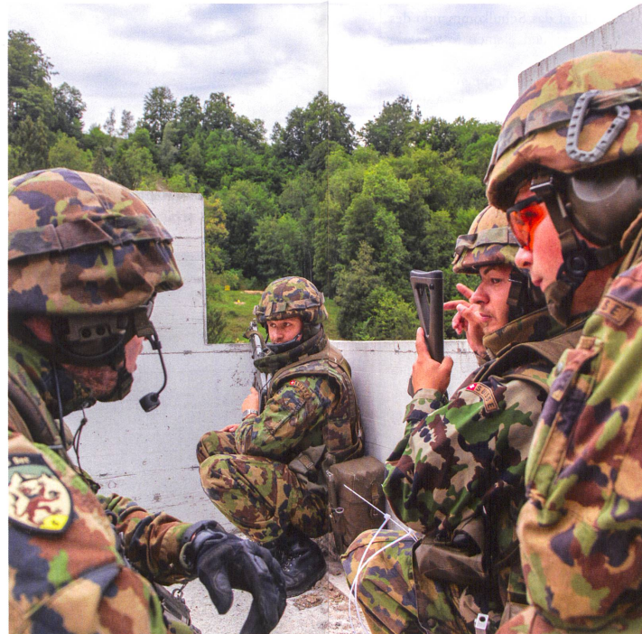
Das 144-jährige Bataillon im Ortskampf.