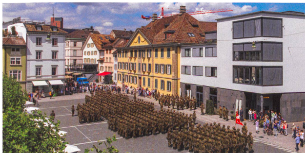
Fahnenabgabe auf dem Neumarkt in Winterthur.