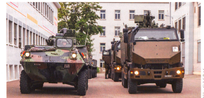
In der Rieter AG: Piranha-2 und GMTF.