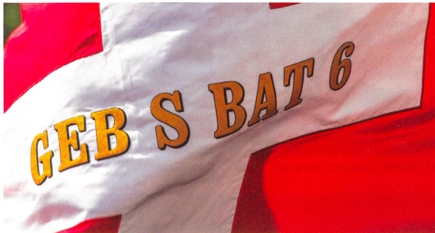
Die Fahne des ältesten Bataillons.