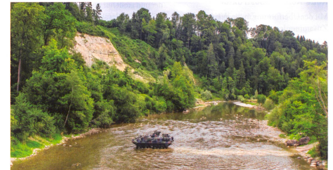
Überwinden des Wasserhindernisses. An der Sitter bei Waldkirch SG.