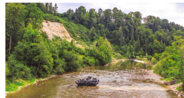
Überwinden des Wasserhindernisses. An der Sitter bei Waldkirch SG.