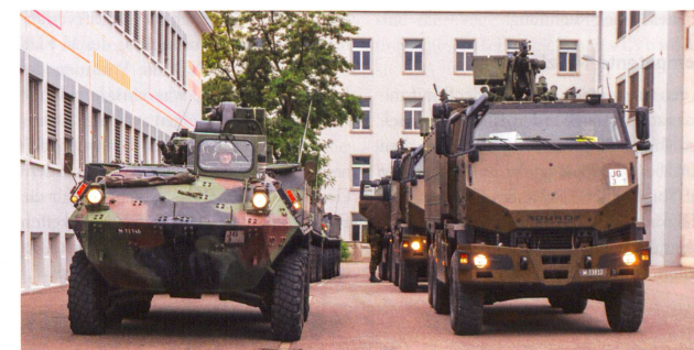
In der Rieter AG: Piranha-2 und GMTF.