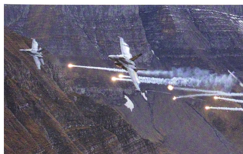
F/A-18-Jets schützen sich mit Flares.