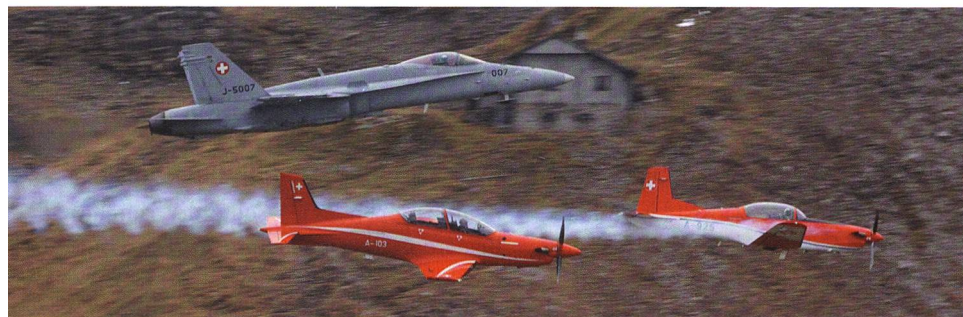
Eine nicht ganz alltägliche Szene: von unten nach oben PC-21, PC-7, F/A-18.