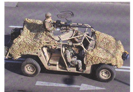
DAGOR von Polaris als neues ISV?

Per Ausschreibung sucht die US-Armee einen Hersteller für ein neues Gruppengefechtsfahrzeug. Das Infantry Squad Vehicle (ISV) muss neun Soldaten und deren Ausrüstung Platz bieten, leicht und wendig