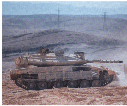
Merkava Mark 4 Barak im Testbetrieb.

Das israelische Panzerkorps hat den neuen Panzer Merkava Mark 4 Barak entwickelt. Wesentliche Merkmale sind die Integration künstlicher Intelligenz und Virtueller Realität (VR). Ein Missionscomputer sammelt die Informationen und übernimmt Aufgaben im Panzer. Das Training wird