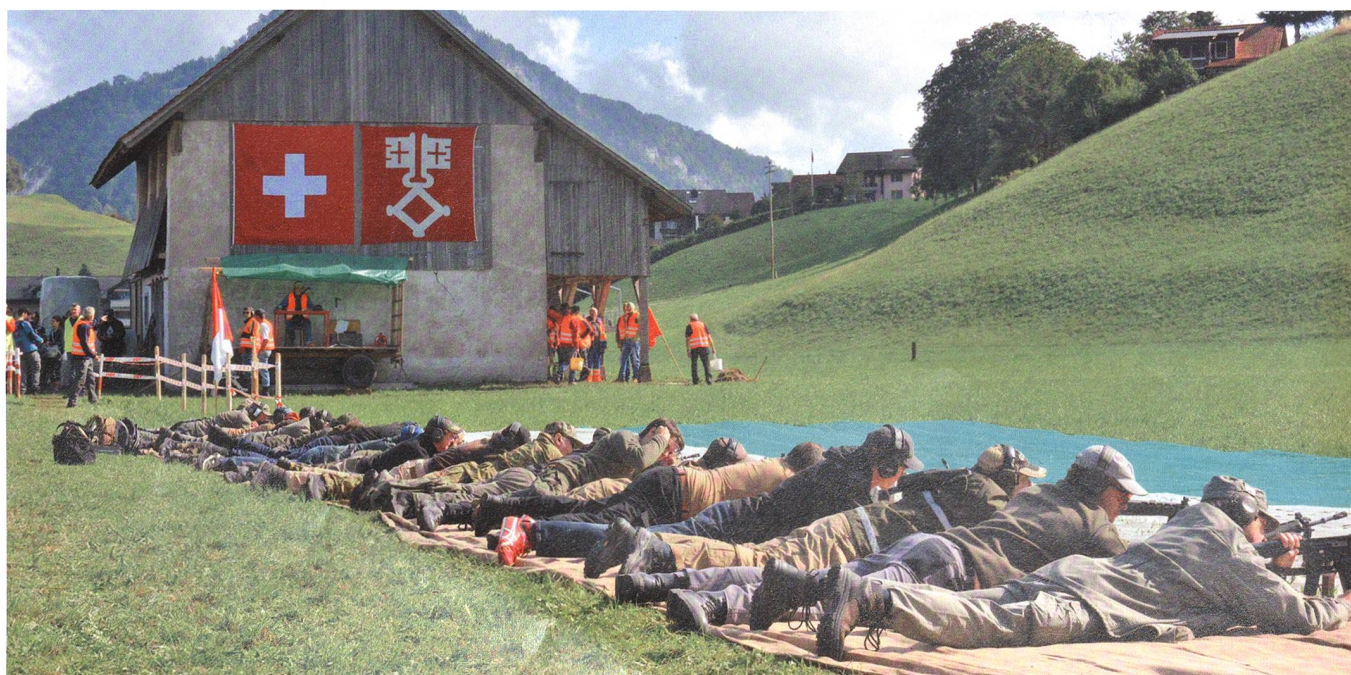
... und dem Gewehr gedenken Eidgenossen der Nidwaldner Verzweiflungsschlacht gegen Frankreich am 9. September 1798.