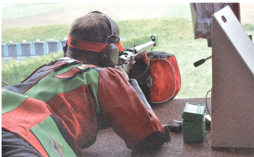
Trotz der Sturmgewehr-Dominanz immer noch populär: der Karabiner 31.