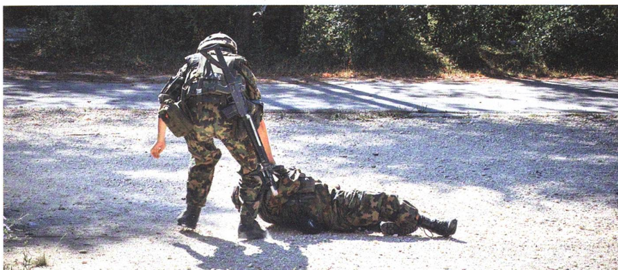
Mit Spezialprogramm schulte die Pz Kp 12/1 den Sanitätsdienst – Seiten 26–29.