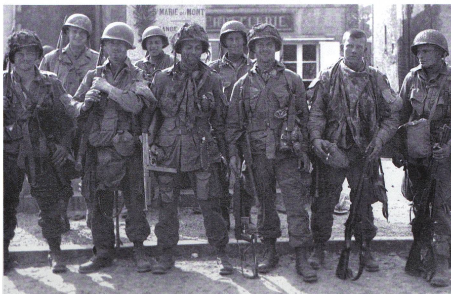
Unscharfes Bild aus der Normandie: Fallschirmjäger der 101. Luftlandedivision.

Präsident Kennedy beförderte ihn zum Generalstabschef der amerikanischen Streitkräfte. Präsident Johnson ernannte ihn zum Botschafter in Saigon, als sich Südvietnam des Vietcong-Ansturms zu erwehren suchte.