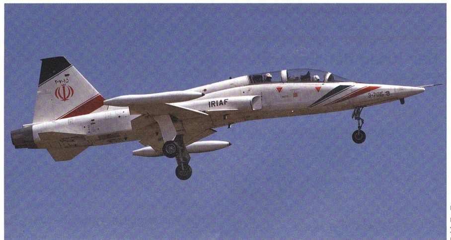
Der Kowsar 3-7015 B der IRIAF, der Luftwaffe der Islamischen Republik Iran.