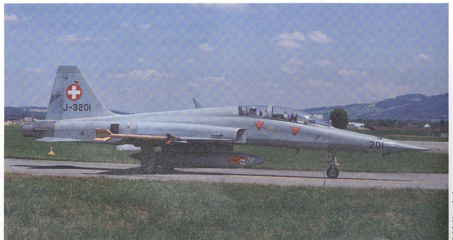
Zum Vergleich: Der F-5-Tiger-Doppelsitzer J-3201 der Schweizer Luftwaffe (2018).