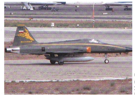
Der Azarakhsh-Einsitzer 3-7330 (1997).

Iran besitzt nur einige Dutzend Kampfflugzeuge. Es handelt sich um russische Modelle oder veraltete US-Flugzeuge, die noch aus der Schah-Epoche vor 1979