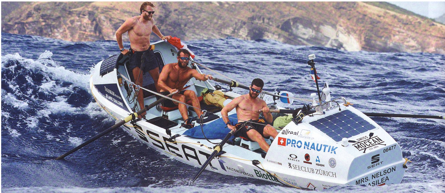
Im Zwei-Stunden-Takt lösten sich die Grenadiere in zwei Zweiertteams im Rudern ab.