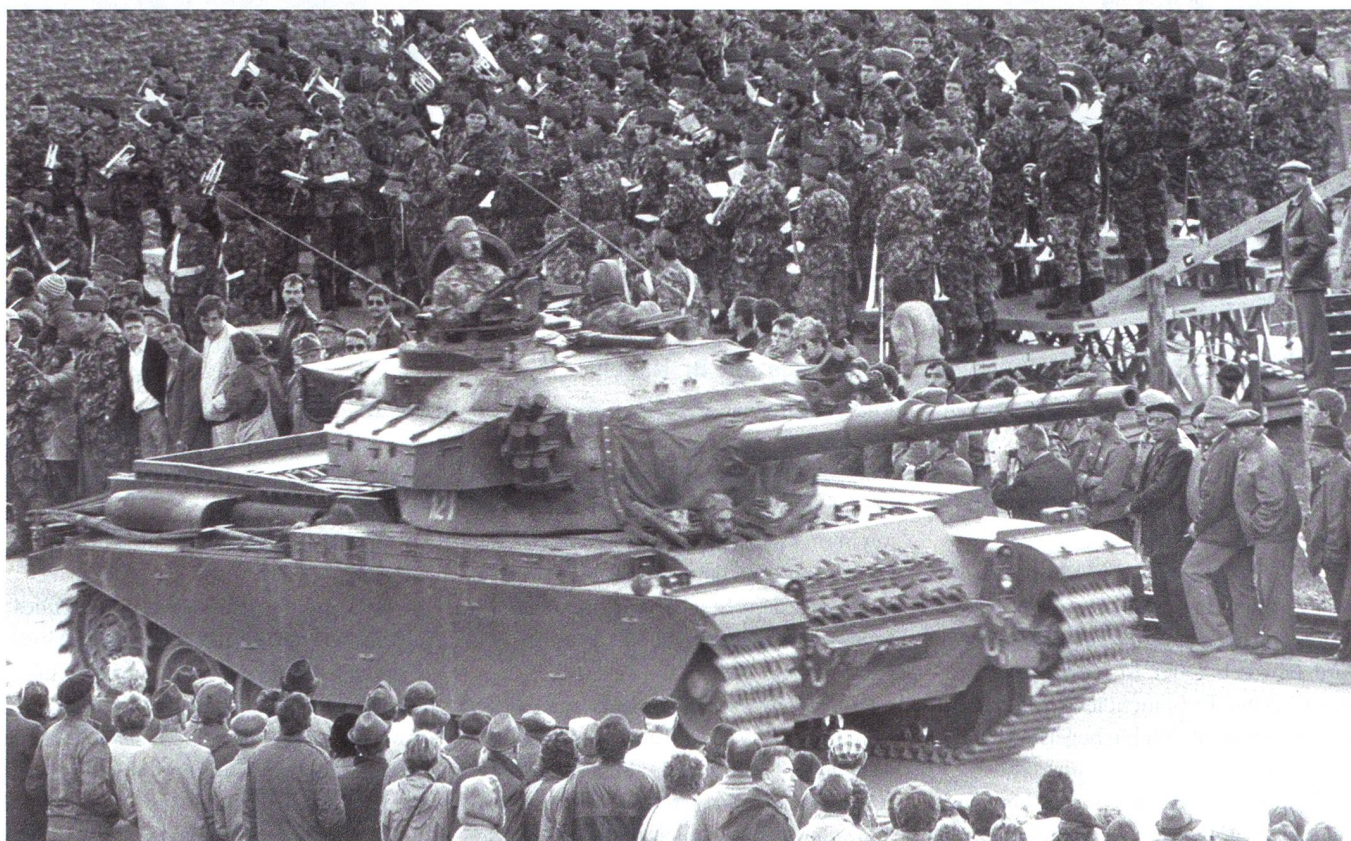
Das waren noch Zeiten, als die Panzer regelmässig defilierten: ein 50-Tonnen-Centurion.

Wie – Herrgott noch mal – kommt man nach Domat Ems, wenn das Auto in Frau-