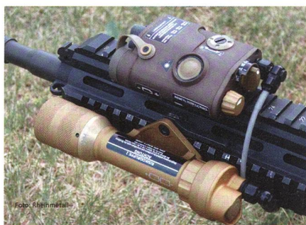
Laser-Licht-Modul für das neue «Sturmgewehr Spezialkräfte leicht».

Rheinmetall liefert Laser-Licht-Paket für Sturmgewehr Spezialkräfte leicht G95 der Bundeswehr. Das als G95 projektierte «Sturmgewehr Spezialkräfte leicht» alias HK416A7 erhält demnächst sein Laser-Licht-Paket. Der Auftrag umfasst die Herstellung und Lieferung von 1745 Sätzen des Laser-Licht-Paketes und hat einen Wert von rund fünf Millionen Euro. Die Lieferung beginnt im ersten Quartal 2019. Kernstück des Laser-Licht-Paketes ist das neu entwickelte und erstmals auf der Euro-