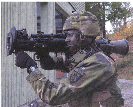
Carl-Gustaf M4 für Schweden.

Als fünftes Land führt Schweden die neueste Version des Mehrzweck-Waffensystems Carl-Gustaf M4 ein. Die 2014 erstmals vorgestellte tragbare Waffe wird von der Schulter abgefeuert und wiegt nur sieben Kilogramm. Als Munition für die rückstoss-