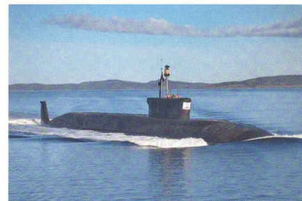
SSBN «Juri Dolgoruky».

Erstmals hat ein russisches strategisches Atom-U-Boot (SSBN) der «Borei»-Klasse vier Interkontinentalraketen (ICBM) in einem Salvantakt abgefeuert. Das SSBN