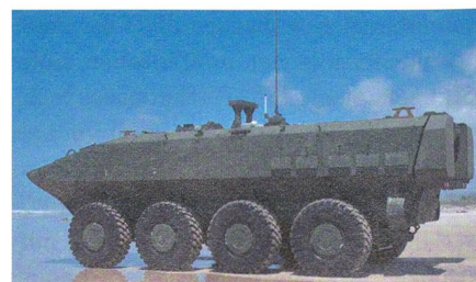
Neues Landungsfahrzeuge für das US Marine Corps.