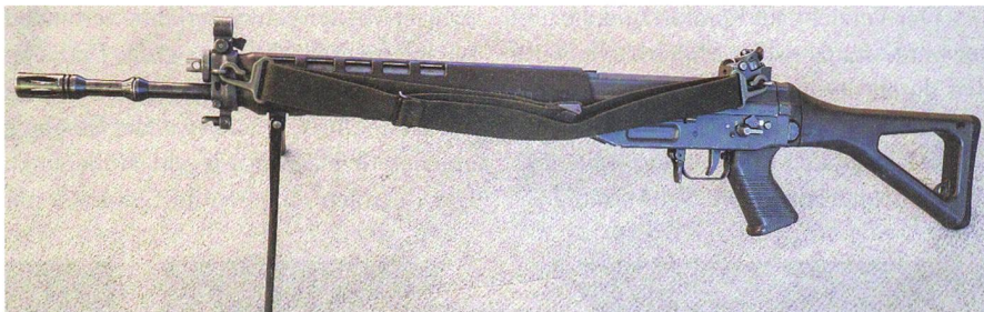
Die IGS kämpft für das Sturmgewehr 90, das zu den Halbautomaten gehört.