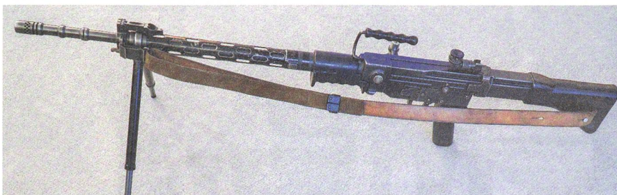
Ein anderer Halbautomat: Das schwerere, unhandlichere Sturmgewehr 57.