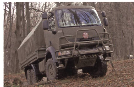
Gelände-Lastkraftwagen Tatra T-810.

Das tschechische Verteidigungsministerium hat Anfang Jahr 26 Tatra T-810 Gelände-Lastkraftwagen mit Pritsche vom Hersteller übernommen; im Mai weitere 40 schwere und mittlere Lkw T-815 mit Container-Rahmen sowie 41 T-815 für