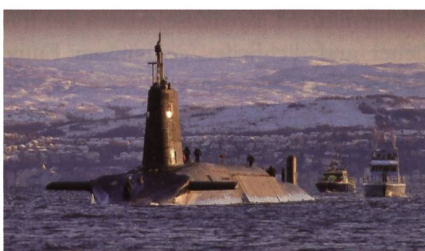
Erneuerung der britischen SSBN-Flotte.

Das strategische U-Boot HMS (SSBN) «VENGEANCE» der Royal Navy hat im Juni 2016 vor der Küste Floridas eine Langstreckenrakete (ohne Gefechtskopf) vom Typ Trident II D5 abgefeuert, welche ihr Ziel vor der Küste Afrikas jedoch verfehlt hat. Da die britische Regierung den missglückten Test einer atomwaffenfähigen Rakete nicht wie eigentlich üblich dem