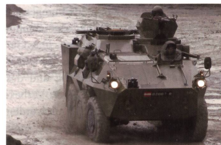
Zusätzliche Radschützenpanzer Pandur für das österreichische Bundesheer.

General Dynamics European Land Systems hat Ende 2016 mit dem österreichischen Verteidigungsministerium einen Vertrag über die Lieferung von 34 zusätzlichen 6x6-Radfahrzeugen Pandur unterzeichnet. Bereits 1994 hatte Österreich Pandur 6x6 beschafft. Die modernisierte