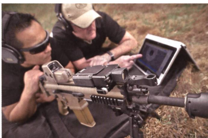
Das Trainingssystem FN Expert.

FN Herstal hat auf der IDEX in Abu Dhabi das Scharfschützentrainingssystem FN Expert vorgestellt. Das von der Tochterfirma Noptel entwickelte Modul kann an jede Waffe montiert werden und bindet Waffe, Schützen und Ausbilder in ein Schulungssystem ein, das von Trockenübungen bis zum scharfen Schuss auf maximal 300m Entfernung reicht. Wegen der