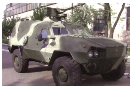
Der Personentransporter Dozor-B.

Die ukrainischen Streitkräfte haben 12 zusätzliche Personentransporter des Typs Dozor-B des Herstellers UkrOboronProm bestellt. Die Auslieferung dieser neuen Tranche von geschützten Fahrzeugen soll in den Jahren 2017 und 2018 erfolgen. Beim Dozor-B handelt es sich um ein ge-