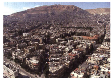
In Raqqah, der Hauptstadt des ISIS-Kalifats, wohnen noch 150 000 Leute.