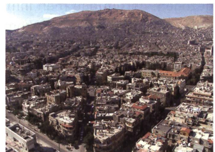
In Raqqa, der Hauptstadt des ISIS-Kalifats, wohnen noch 150 000 Leute.