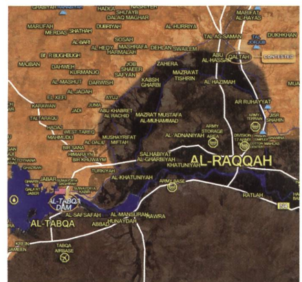
Lage 23.3.17. Der Tabqah-Damm ist gefallen, Stoss auf Flugplatz steht bevor.