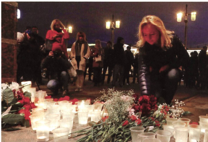
St. Petersburg, 3. April 2017, Metrostation am Technikum: Blumen und Kerzen.

Mehrere Jahre lang blieben Russlands Metropolen vom Terror verschont – bis am 3. April 2017 eine Bombe in der U-Bahn von St. Petersburg 14 Menschen in den Tod riss und 50 verletzte. Ganz in der Nähe fanden Polizisten eine zweite Bombe, die sie entschärften. Präsident Putin befand sich in seiner Geburtsstadt, als die Bombe explodierte, war aber nicht das Ziel.