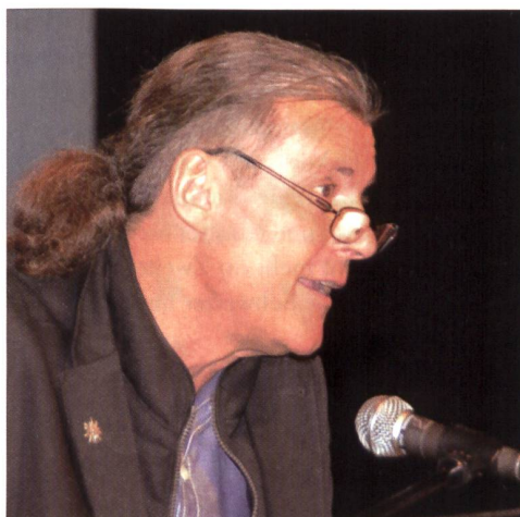
Freysinger: Pro Armee, gegen Pazifisten.