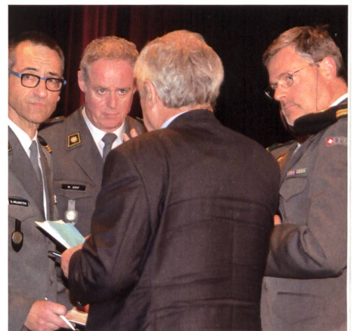
Time-out vor der dezisiven Abstimmung.