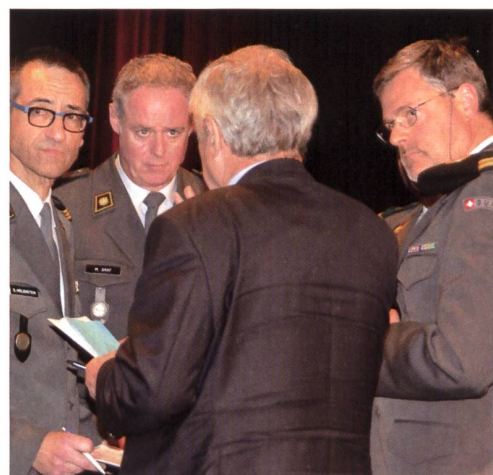
Time-out vor der dezisiven Abstimmung.