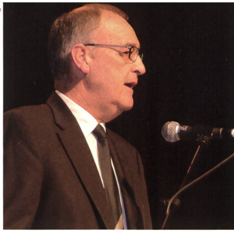
Bundesrat Guy Parmelin: Prioritäten setzen.