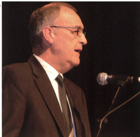
Bundesrat Guy Parmelin: Prioritäten setzen.