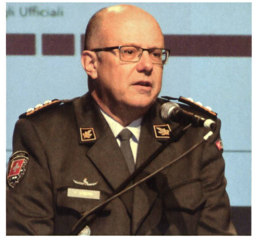
Armeechef Rebord: 35000 Mann in 10 Tagen.