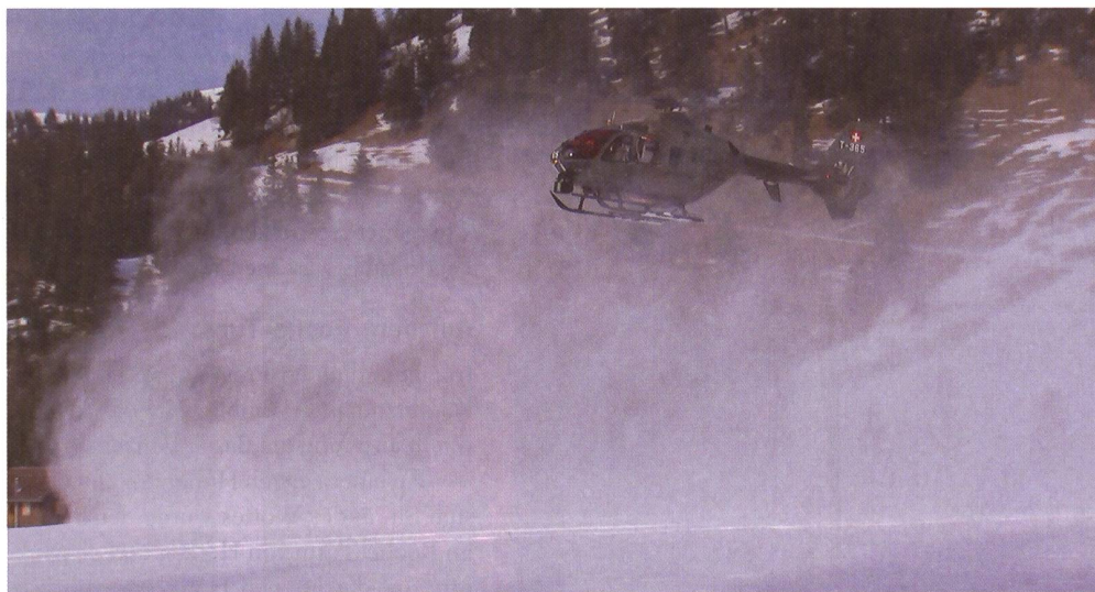
Aufgewirbelter Schnee hindert den Helikopter-Piloten am Abschätzen der Höhe.