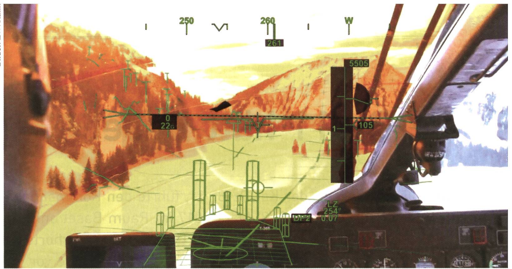
Der Heli wird von einem Piloten im rechten Sitz gesteuert. Hptm Hügli testet das System auf dem linken Sitz. Zur Visualisierung ist eine orange Folie aufgeklebt.

Dies ist, wie der REGA-Pilot Lukas Kistler ausführte, für deren Operationen von Bedeutung. Obwohl alle Helis künftig mit einem solchen System ausgerüstet werden, wird es wohl in erster Linie eine Kostenfrage werden. Wünschenswert ist es. ■