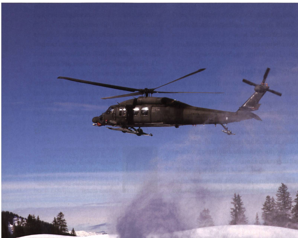
Auf der Älggialp im Kanton Obwalden gelangte bei den Testflügen auch ein amerikanischer Black Hawk zum Einsatz.