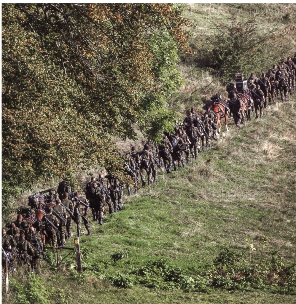
Das Nutt-Bild sagt mehr als 1000 Worte: Aufstieg, Zusammenhalt, Rückgrat der Armee.