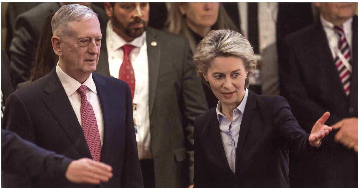
Der amerikanische Verteidigungsminister, General James Mattis, wird von der Deutschen von der Leyen in den Saal geleitet.

Die Bereitschaft zu gestiegenen Rüstungsausgaben verknüpfte von der Leyen schliess-