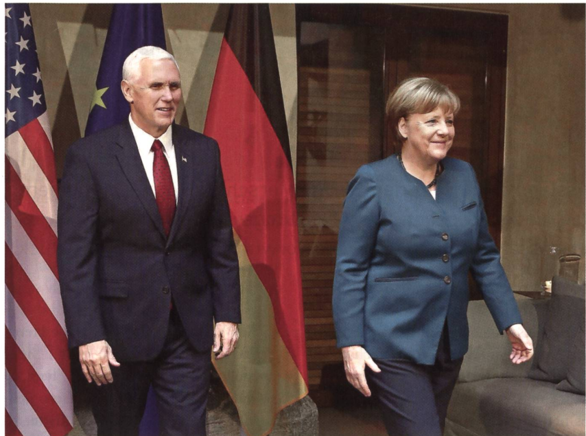
Der amerikanische Vizepräsident Mike Pence und Kanzlerin Angela Merkel.

Vizepräsident Pence, der in München bei seinem ersten grossen internationalen Auftritt als zweiter Mann Amerikas präsidentieller wirkte als sein Präsident, drückte keinen Reset-Button wie sein Vorgänger Joe Biden 2009. Offenbar war es ihm und seinem Team gelungen, aus den bislang widersprüchlichen Signalen seiner Regierung eine klare Botschaft zu formen, die er, so Pence, von Präsident Trump persönlich mitbringe.