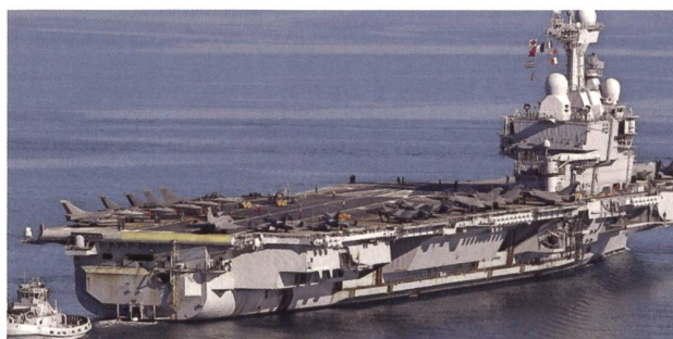
Frankreichs Träger Charles de Gaulle.

Auch bisherige Tabuthemen wie eine reale europäische Verteidigung mit starken Streitkräften zum Schutz des EU-Territoriums und der europäischen Länder müssen schnell realisiert werden, sollten sich die USA aus ihrer bisherigen Schutzmachtfunktion als das Rückgrat der NATO sukzessive zurückziehen. In die-