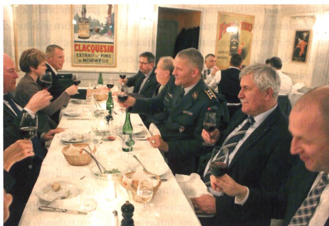
Nachessen im Café Fédéral, dem Bistro am Bundesplatz.