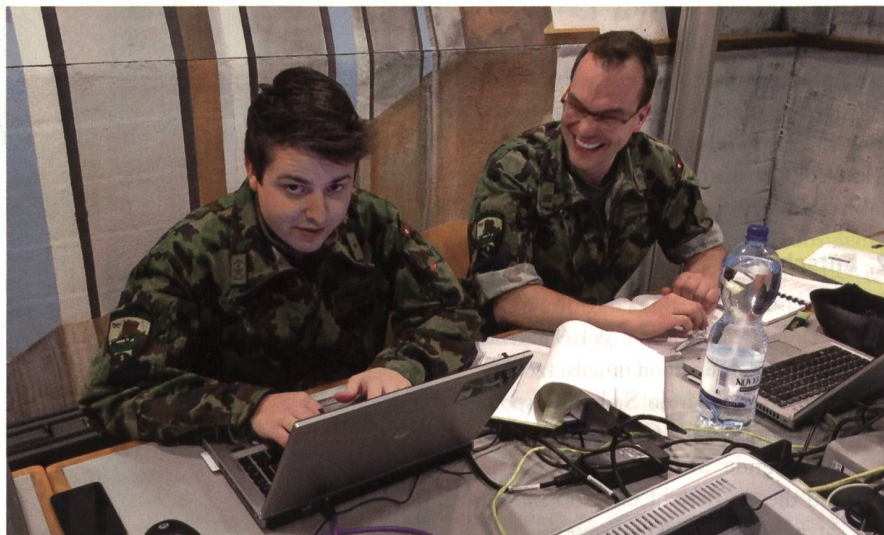
Auch Spass an der Ausbildung gehört dazu.

Im Technischen Lehrgang müssen die Teilnehmer anhand konkreter Vorgaben Stufe Bat ein detailliertes Ausbildungskonzept erstellen, welches dem Bat Kdt prä-