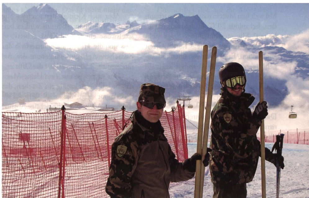
Herrliches Wetter: Motivierte Helfer aus dem Zürcher Inf Bat 65, dem Skorpion-Bat.