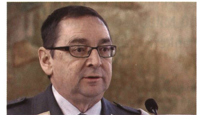
Schmid: Ja zum Schweizerpsalm.

Der glühende Patriot Schmid: «Wir haben eine wunderbare Nationalhymne. Wir brauchen keine andere.» So erklangen dann vom Schweizerpsalm die erste und die vierte (die wichtigste) Strophe.