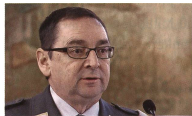
Schmid: Ja zum Schweizerpsalm.

Der glühende Patriot Schmid: «Wir haben eine wunderbare Nationalhymne. Wir brauchen keine andere.» So erklangen dann vom Schweizerpsalm die erste und die vierte (die wichtigste) Strophe.