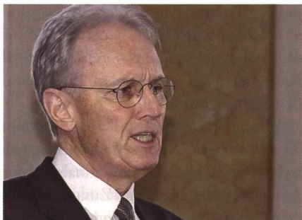
Nationalrat Hans-Ulrich Bigler.

Es war einer jener herrlichen Wintertage, in denen die Stadtkirche St. Nikolaus zu Frauenfeld lichtdurchflutet in barockem Glanz erstrahlt, als die FU/Uem S 61 am 3. Februar 2017 über 70 Anwärter zu Wachtmeistern, Fourieren, Feldweibeln, Hauptfeldweibeln und Leutnants beförderte. Nationalrat Bigler rief den Kadern zu: «Sie sind die Differenz, die unser Land ausmacht.»