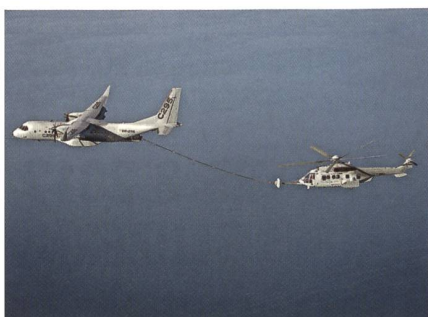
Betankung eines Helikopters.

Airbus Defence and Space hat die Luftbetankungsversuche mit seinem kleinen Transporter C295W fortgesetzt. Die Tests wurden mit einem H225M von Airbus He-