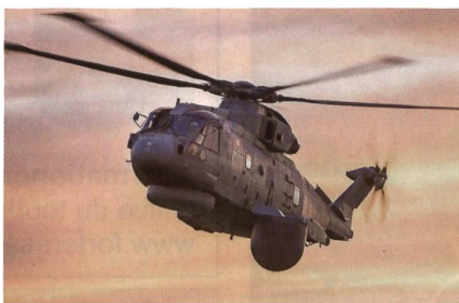
Überwachungshelikopter Merlin Mk2.

Lockheed Martin hat nun offiziell den Auftrag für die Entwicklung des Crowsnest-Systems zur Einrüstung in die Merlin-Helikopter erhalten. Radar und Elektronik stammen von Thales. Der Vertrag hat einen Wert von 305 Millionen Euro. Seine Unterzeichnung folgt anderthalb Jahre, nachdem die Vorgängerregierung die Grundsatzentscheidung für das Thales-