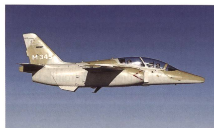
Trainingsflugzeug M-345 von Leonardo.

Das vom Wirtschaftsministerium finanzierte Programm sieht zunächst fünf Flugzeuge vor, die ab 2019 geliefert werden sollen. Insgesamt liegt der Bedarf bei rund 45 M-345 (T-345 in Italien). Sie werden langfristig die derzeit 137 MB-339 ersetzen und die