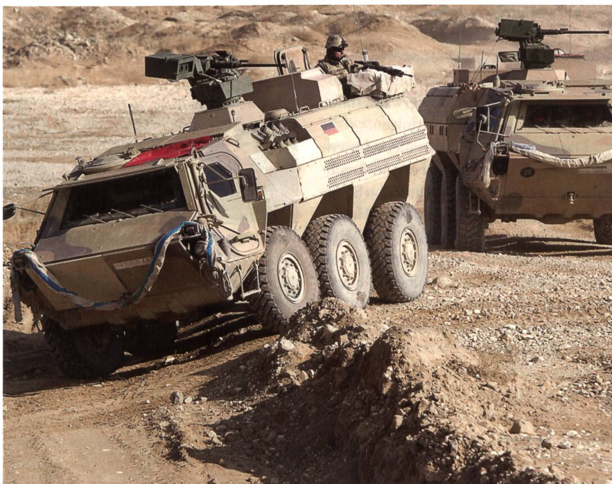
Der geschützte Transportpanzer Fuchs von Rheinmetall im Einsatz in Mali.