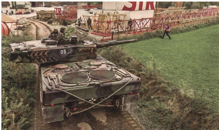
Im Tiefflug enthüllt die Drohne: Der Panzer 05/PG2/M7734X richtet das Rohr nach Süden, wo der Gegner lauert. Wie die Spuren verraten, ist er ins Kieswerk eingedrungen.