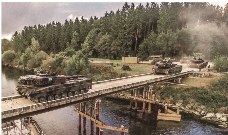
Flussübergang der Pz Kp 29/2. Das Drohnenbild zeigt die Kadenz der Kompanie. Erkennbar insgesamt vier Leoparden.