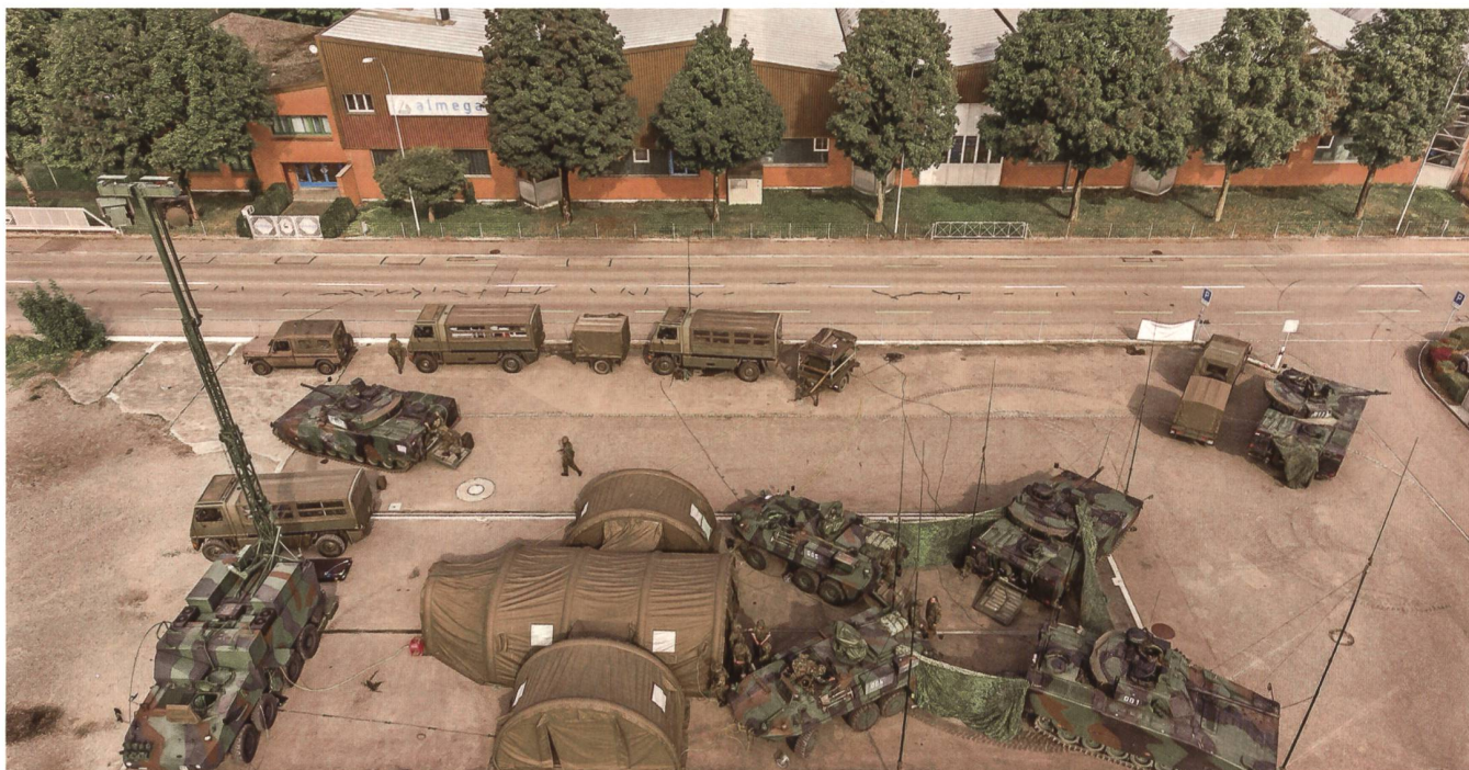
Die Drohne nimmt die Szene schräg auf. So ist oben im Bild unschwer die bekannte Firma Almega, Metallbau AG, Weinfelden, Amriswilerstrasse 55, zu erkennen, womit die Drohne den genauen Standort des Kommandos identifiziert hat. Erkennbar die Fahrzeuge: ein RAP-Panzer, insgesamt sechs Kommando- und Schützenpanzer CV-90 (vorne rechts 001) und zwei Piranha.