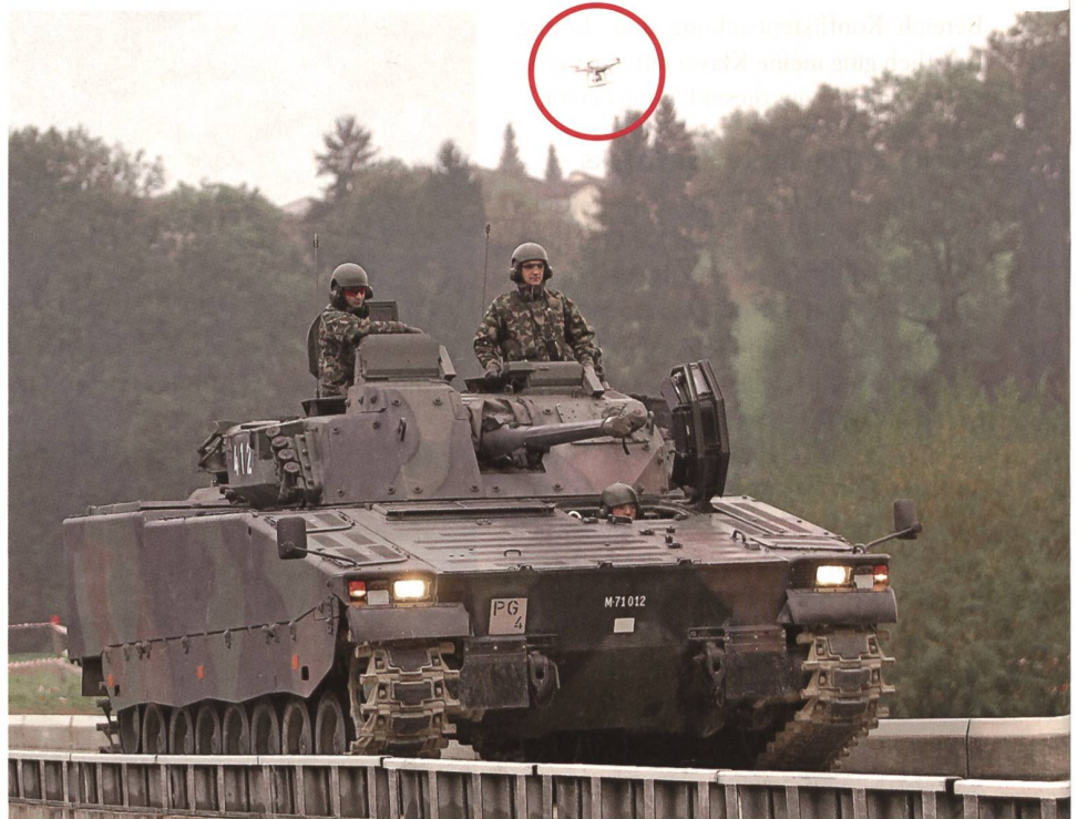
So klein ist die chinesische DJI Phantom 4. Die Männer auf dem Leopard sind mit dem Flussübergang (Thur) so beschäftigt, dass sie den Spion überhören.