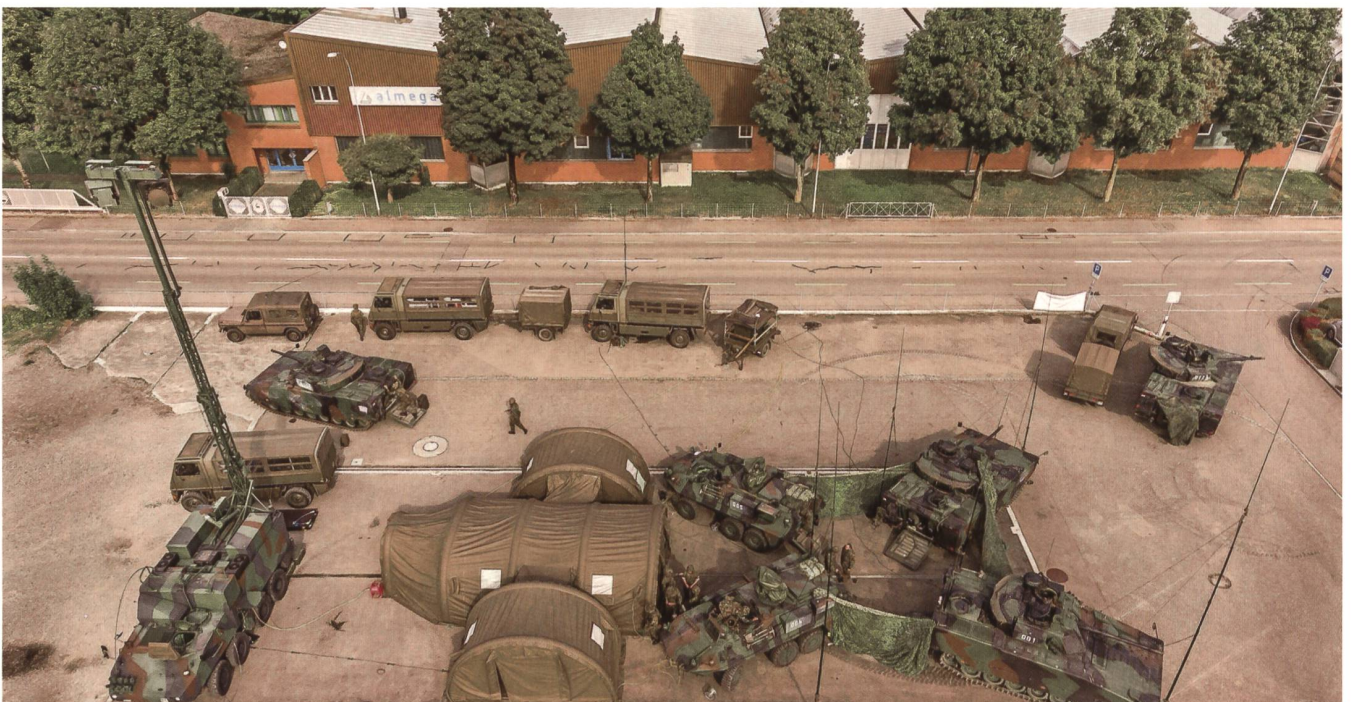
Die Drohne nimmt die Szene schräg auf. So ist oben im Bild unschwer die bekannte Firma Almega, Metallbau AG, Weinfelden, Amriswilerstrasse 55, zu erkennen, womit die Drohne den genauen Standort des Kommandos identifiziert hat. Erkennbar die Fahrzeuge: ein RAP-Panzer, insgesamt sechs Kommando- und Schützenpanzer CV-90 (vorne rechts 001) und zwei Piranha.