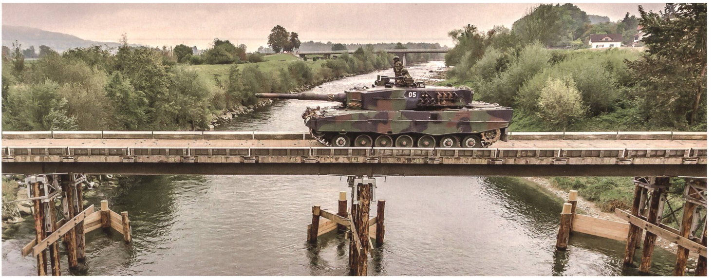
Das Drohnenbild zeigt exemplarisch die Kooperation von Genie- und Panzertruppe: Ein Leo überquert die Stahlträgerbrücke.