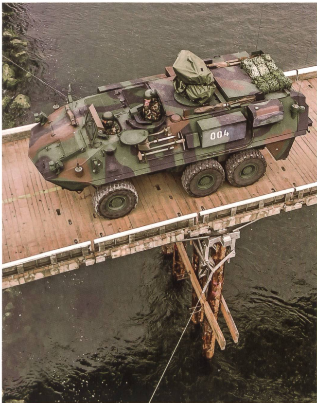
Der Radschützenpanzer 004 über dem Thurlauf. Gut erkennbar selbst Details wie Beil, Schaufel, Pickel und Hammer.