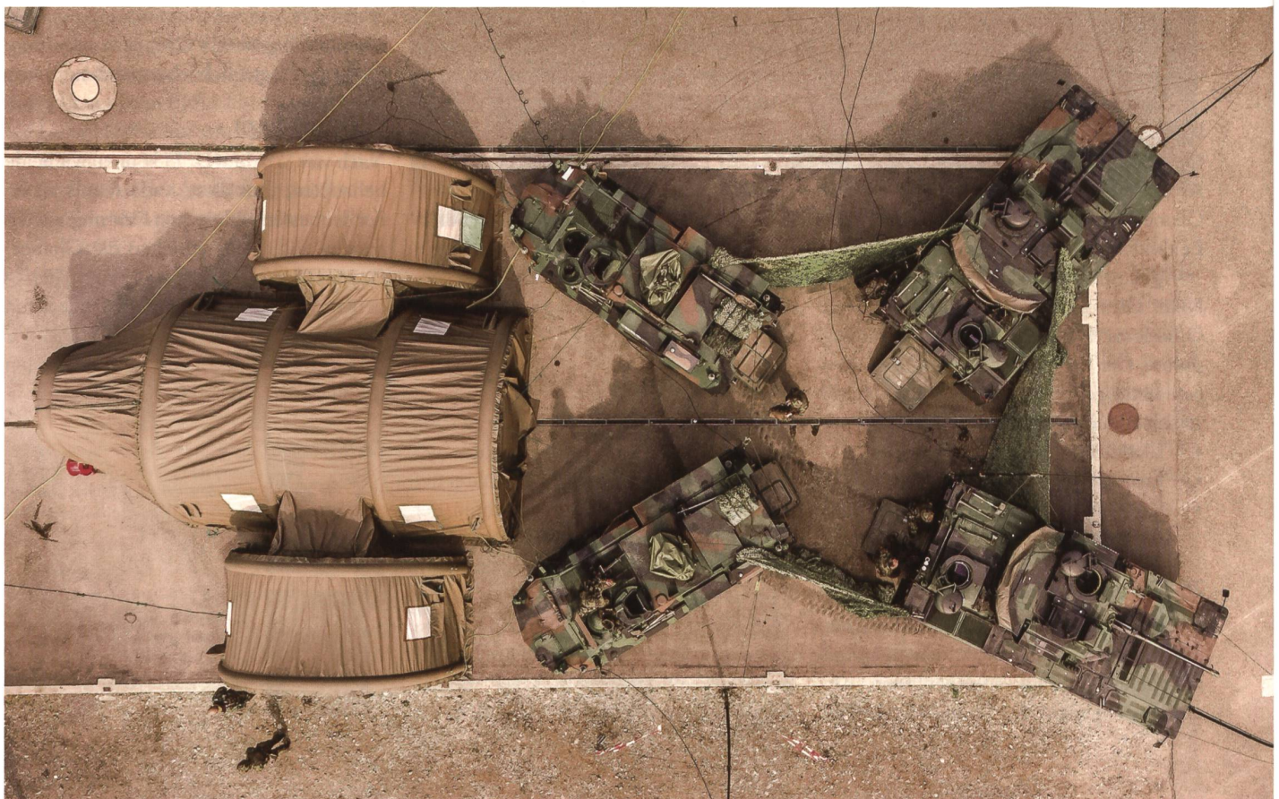
Zu Beginn der VTU «NEPTUN» überquerten der Kdt Pz Bat 29 und der Stab die Thur. Von Weinfelden aus führen sie das Bat.