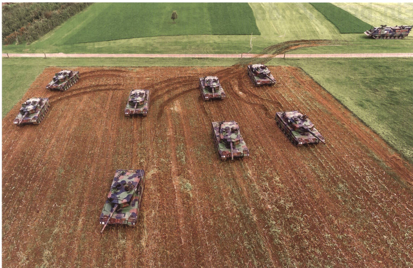
Die Aufnahme zeigt eine Szene, wie sie heute auch für Schweizer Panzertruppen selten geworden ist: den Angriff von acht Leoparden der Pz Kp 29/1 über freies Feld auf ein Terroristennest im Tanklager nördlich von Berg. Rechts oben der Büffel.