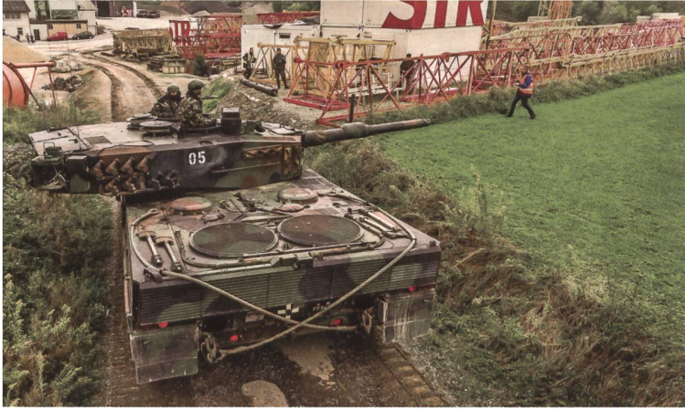
Im Tiefflug enthüllt die Drohne: Der Panzer 05/PG2/M7734X richtet das Rohr nach Süden, wo der Gegner lauert. Wie die Spuren verraten, ist er ins Kieswerk eingedrungen.