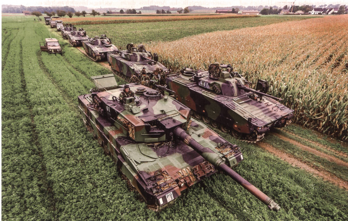
Vorne links von der Kamera aus der Leopard 01, rechts der CV-90 401. Dahinter aufgereiht die Schützenpanzer der Panzergranadiere, im Feld ein Schiedsrichter-Puch. Hinter den Spitzenfahrzeugen mit gelber Weste der Clusterchef und Kader der beiden Kp. Auf den Spitzenpanzern beobachten die Wagenchefs nach vorne und zur Seite; erkennbar in den CV-90 die Fahrer.