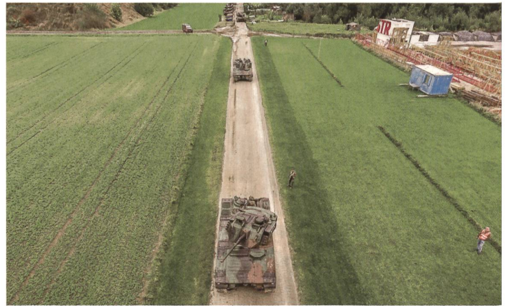
Die Spitzenfahrzeuge der Pz Kp 29/2 rücken parallel zum Kieswerk gegen Westen vor. Hinten das Gros der Kompanie.