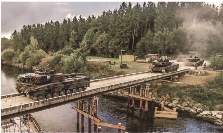
Flussübergang der Pz Kp 29/2. Das Drohnenbild zeigt die Kadenz der Kompanie. Erkennbar insgesamt vier Leoparden.