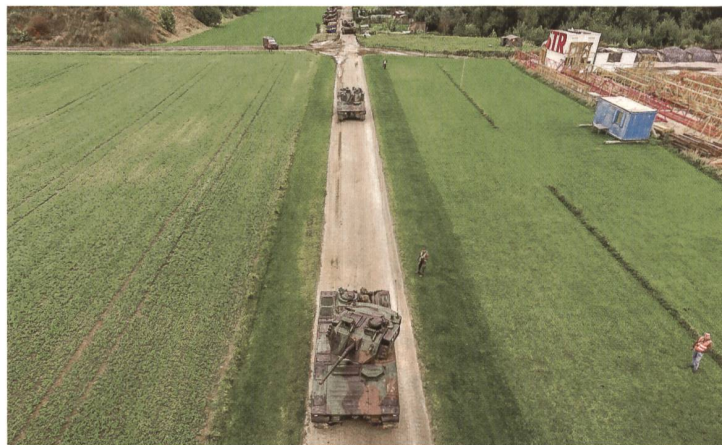
Die Spitzenfahrzeuge der Pz Kp 29/2 rücken parallel zum Kieswerk gegen Westen vor. Hinten das Gros der Kompanie.