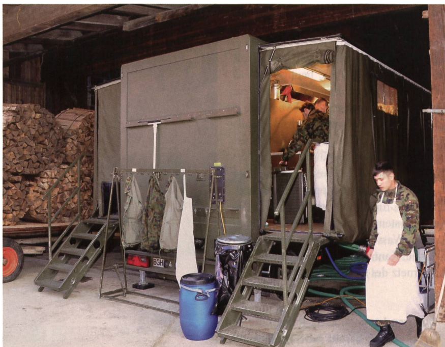
Mobiles Verpflegungssystem in einem Bauernhof bei Münchenbuchsee.

Trotz grosser Attraktivität stehen der Armee zuwenig Trp Köche und Kü C zur Verfügung. Deshalb hat man die Vorausset-