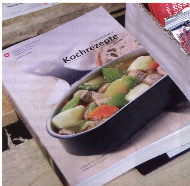
Das wohl beliebteste Reglement der Armee: Kochrezepte.