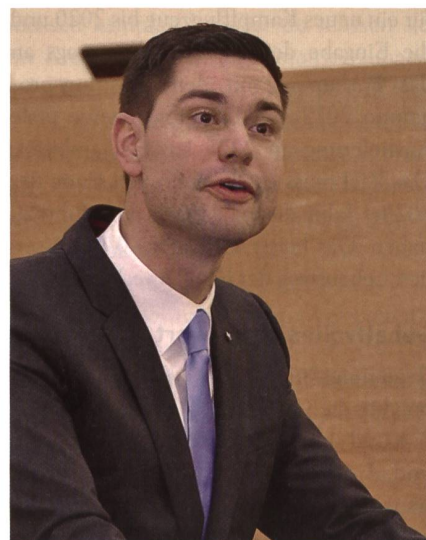
Grossratspräsident Benjamin Giezendanner.