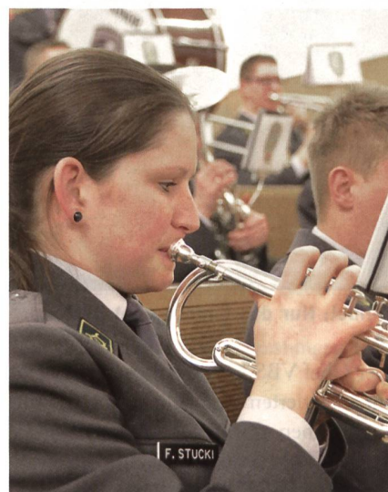
Melodien des Rekrutenspiels 16-2.