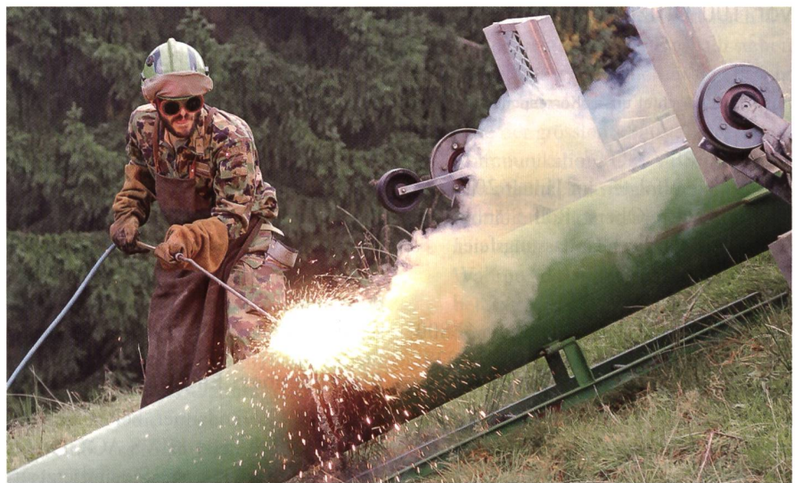
VTU «TECHNICO 16»: Ein Rettungssoldat mit Sauerstofflanze zerlegt einen Mast.

Der Chef VBS hat deshalb einen Bericht zur integrierten Luftverteidigung in Auftrag gegeben, der im Frühjahr 2017 erwartet wird. Der Bundesrat erwarte die ersten Flugzeuge ab 2025 am Himmel.