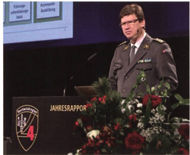
KKdt Schellenberg, designerter Kdt Op.