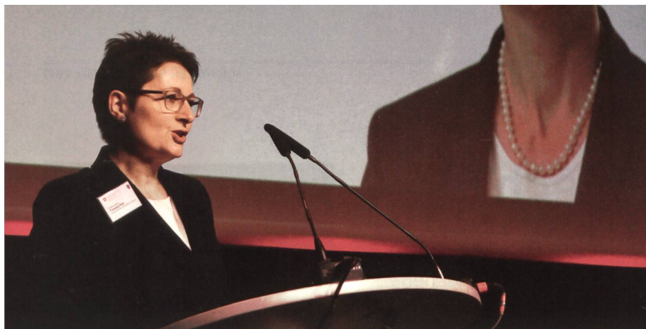
Regierungsrätin Franziska Roth: «27 militärische Infrastrukturen im Aargau.»