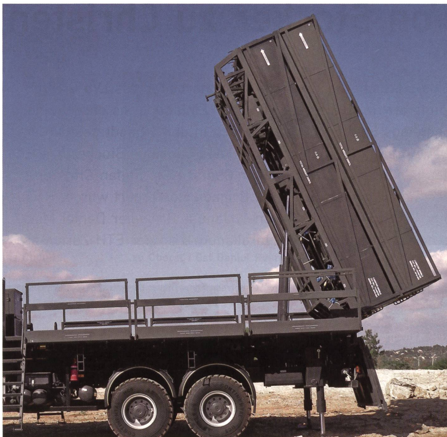
In der Schweizer BODLUV-Evaluation schied Spyder am 25. August 2015 aus.

Die Schweiz sucht ein Luftabwehrsystem im Bereich um die 40 Kilometer, nicht aber in der kurzen Reichweite von