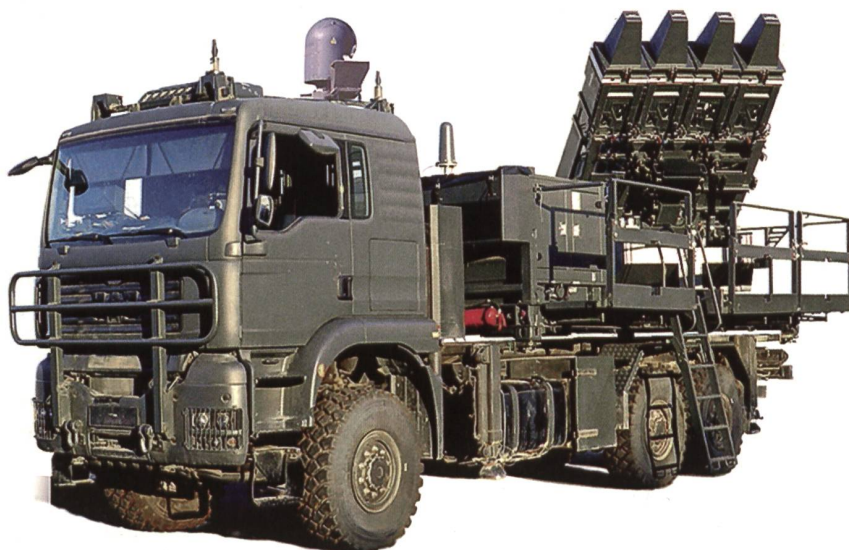
Spyder wurde von den staatlichen Firmen Rafael (Haifa) und IAI (Tel Aviv) gebaut.

Gemäss dem Bericht von Kurt Grüter fiel der Entscheid, Spyder aus dem Rennen zu nehmen, in der Projektaufsicht eindeutig. Auf Seite 43 schreibt Grüter: «Unter Namensaufruf entscheidet die Kommission mit einer Gegenstimme, die Lenkwaffe SPYDER-MR von Rafael nicht weiter zu verfolgen.»