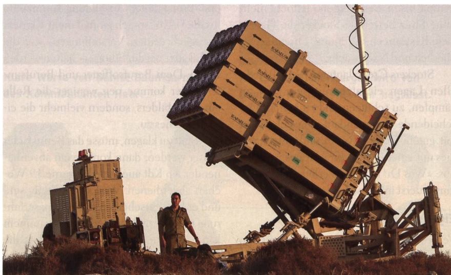
Iron Dome bewährt sich in Israel, wäre aber das falsche System für die Schweiz.

Iron Dome. Das israelische System ist spezialisiert auf die Abwehr der rudimentären, un gelenkten Hamas-Geschosse. Die Schweizer Flab dagegen braucht ein Mittelstreckensystem gegen andere Ziele.