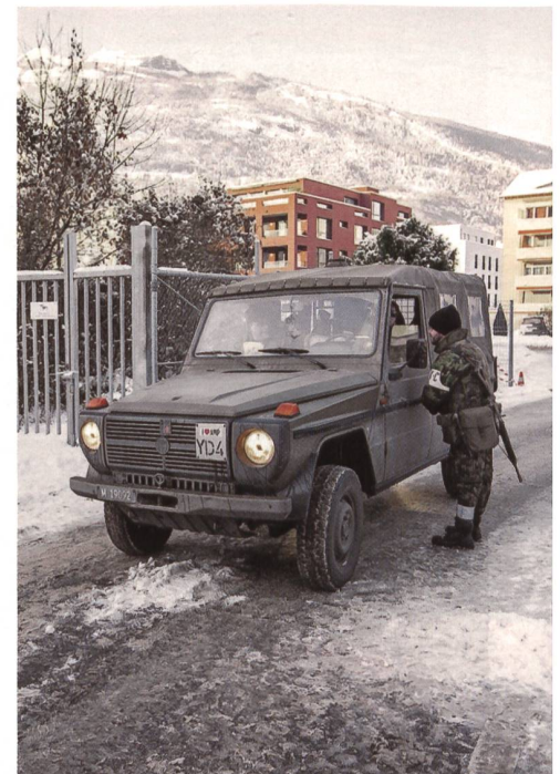
Die Bodentruppen erledigten – wie die Luftwaffe – alle Aufträge zur vollen Zufriedenheit der Behörden. Strenge Kontrollen mitten in Davos gehörten zum Pflichtenheft des tüchtigen, wetterharten Infanteriebataillons 56 (Aargau).