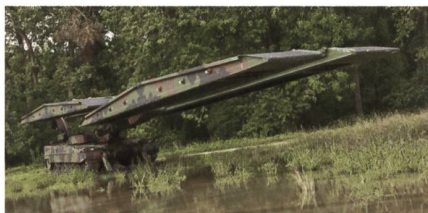
Das Brückenlegesystem Leguan.

Zwischen der deutschen Beschaffungsbehörde und Krauss-Maffei Wegmann wurde Ende 2016 ein Vertrag über die Lieferung von sieben Leguan-Brückenlegesystemen unterzeichnet. Mit dem Leguan lassen sich Gewässer und Geländeeinschnitte auch