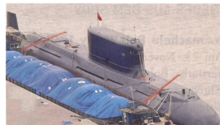
Chinesische U-Boote der «Yuan»-Klasse.

Pakistans Marine beschafft acht U-Boote aus China. Die ersten vier U-Boote sollen in China gebaut und 2022/23 ausgeliefert werden. Die restlichen U-Boote sollen dann mit technischer Unterstützung Chinas und Materialpaketen bis 2028 in Pakistan gebaut werden.