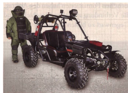
Geländegängiges Elektrofahrzeug LTEV.

Eine Akkuladung ermöglicht ca. drei Stunden Fahrt und Betrieb. Vier unabhängig voneinander arbeitende Federbeine mit hydraulischen Bremsen bringen den LTEV durchs Gelände. Der Buggy bietet Platz für einen vollausgestatteten Kampfmittelbe-