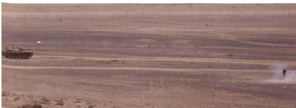
Demonstration in der Wüste: Der Spike-SR-Schütze nimmt den M-60 ins Visier.