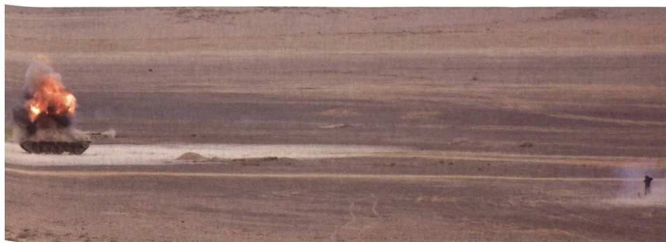
Der Spike-SR-Schütze hat den M-60-Panzer getroffen, der in Flammen aufgeht.