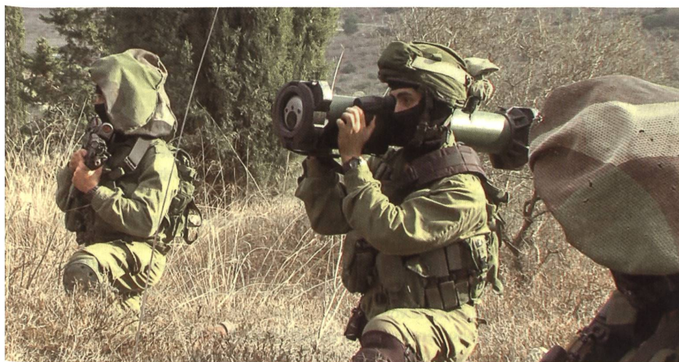
Israelischer Infanterietrupp. In der Mitte der Schütze der Spike-SR-Rakete.