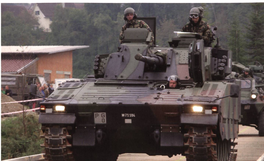
Pz Bat 29: Der Kommandopanzer 001 überquert eine Stahlbrücke. Das Bataillon gehört zur Stufe 2 und bleibt wie die Kompanien (Stufe 3) am FIS angeschlossen.