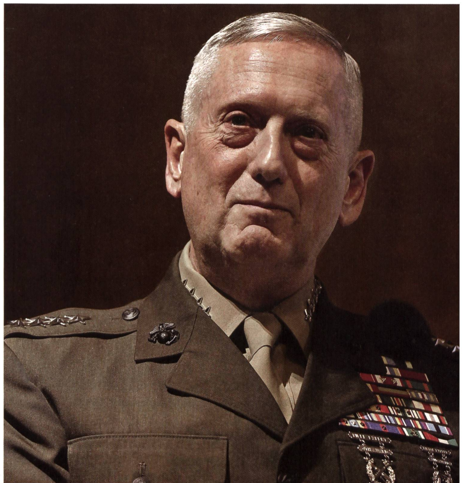
Trumps neuer Verteidigungsminister James Mattis.

In seinem Gespräch mit der New York Times hatte sich Trump überrascht davon gezeigt und angedeutet, auch bei diesem Thema von seiner harten Wahlkampflinie abzuweichen.