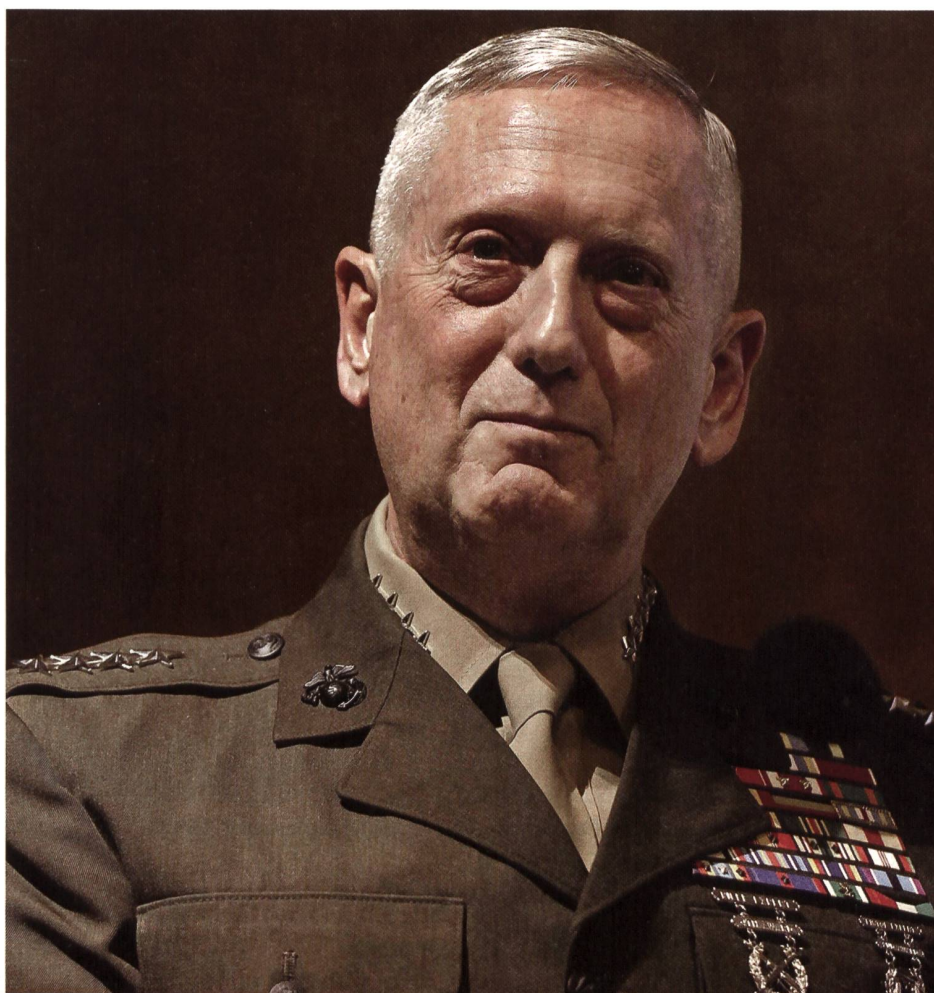
Trumps neuer Verteidigungsminister James Mattis.

In seinem Gespräch mit der New York Times hatte sich Trump überrascht davon gezeigt und angedeutet, auch bei diesem Thema von seiner harten Wahlkampflinie abzuweichen.