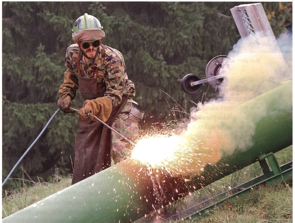
Ein Rettungssoldat mit Sauerstofflanze zerlegt einen Mast.