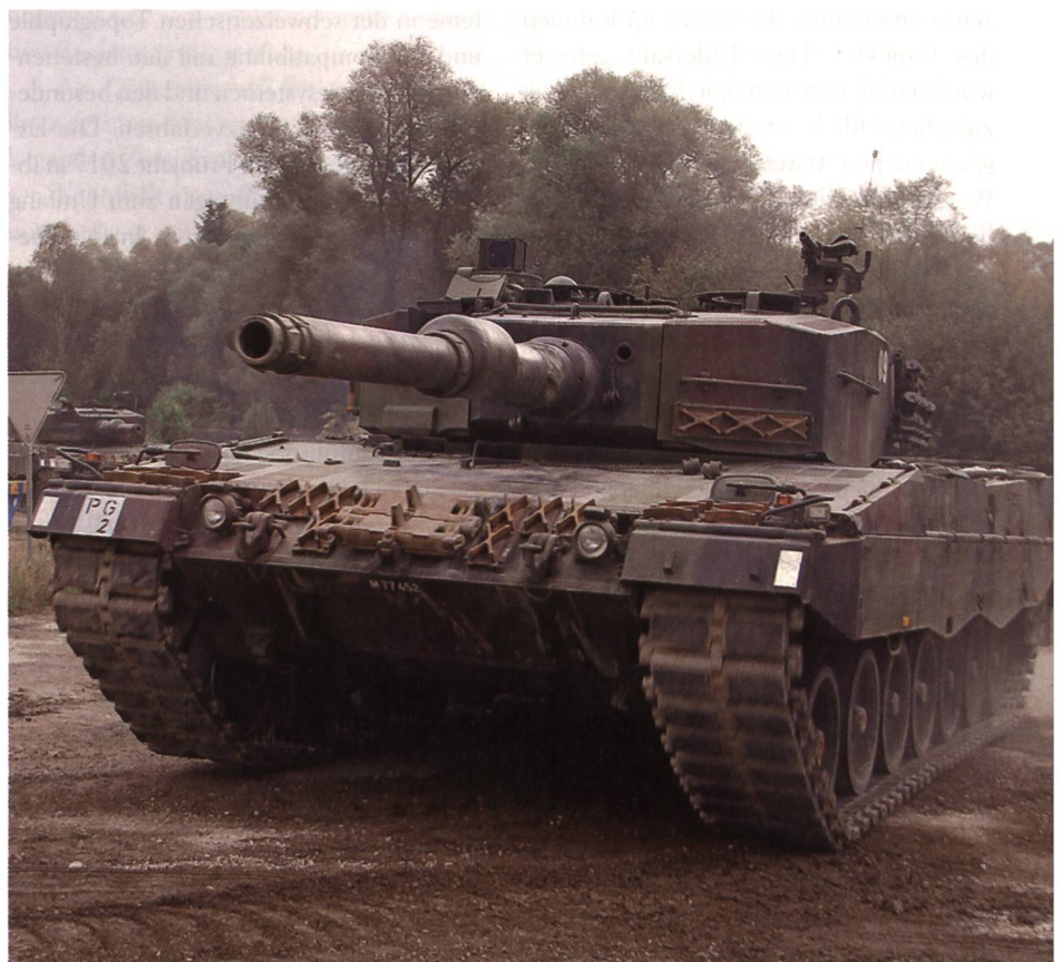
Panzerbataillon 29: Eindrehen zum Angriff auf das Kieswerk Bürglen/Thurgau.