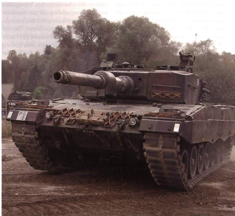
Panzerbataillon 29: Eindrehen zum Angriff auf das Kieswerk Bürglen/Thurgau.