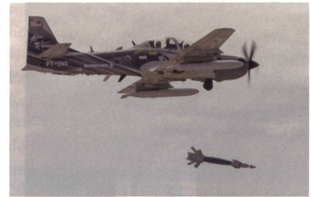
A-29 Super Tucano beim Abschuss einer gelenkten Bombe.

Die Tests sind eine Reaktion auf die zahlreichen Einsatzgebiete der letzten Jahre, wo die US Air Force die Flugstunden ihrer teuren Kampffjets verwenden, um Aufständische und Terroristen zu bekämpfen, die über keine wirkungsvolle Luftab-