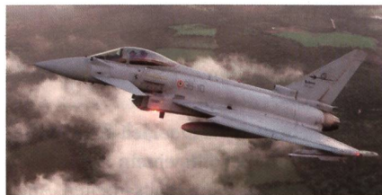
Italienischer Eurofighter abgestürzt.

Ende September stürzte an der Terracina Airshow ein Eurofighter Typhoon der italienischen Luftwaffe ab. Der Pilot rollte während seiner Flugvorführung den Eurofighter aus einer vertikalen Flugbewegung