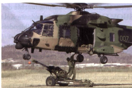
Deutschlands NH90 können wieder Aussenlasten transportieren.

Die Sicherheit der Besatzung und des Personals am Boden stand auf dem Spiel. Der NH90 ist in der Lage, Aussenlasten