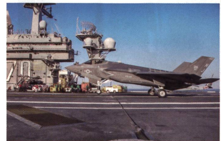
Landeversuch der F-35C Lightning II auf der USS Carl Vinson.

Während einer Übungsfahrt des Flugzeugträgers USS Carl Vinson vor Südkalifornien landete und startete erstmals auch eine F-35C Lightning II auf dem Träger.