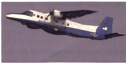
Zusätzliche Dornier für Bangladesch.

RUAG Aviation hat einen Vertrag über den Verkauf von zwei neuen Dornier-228-Flugzeugen an die Marine von Bangladesch abgeschlossen. Dies nachdem Bangladesch bereits 2011 zwei Dornier 228 gekauft hatte. Mit den neuen Flugzeugen sollen die bestehenden Kapazitäten zur Überwachung der Seewege, der Hoheits-