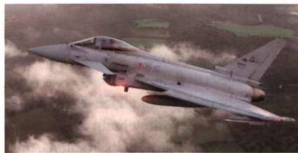
Italienischer Eurofighter abgestürzt.

Ende September stürzte an der Terracina Airshow ein Eurofighter Typhoon der italienischen Luftwaffe ab. Der Pilot rollte während seiner Flugvorführung den Eurofighter aus einer vertikalen Flugbewegung