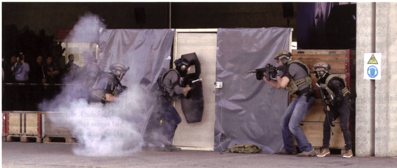
In Thun zeigte Ruag eine kombinierte Übung der Armee mit Polizei, Sanität und Feuerwehr zum Thema Geiselnahme.