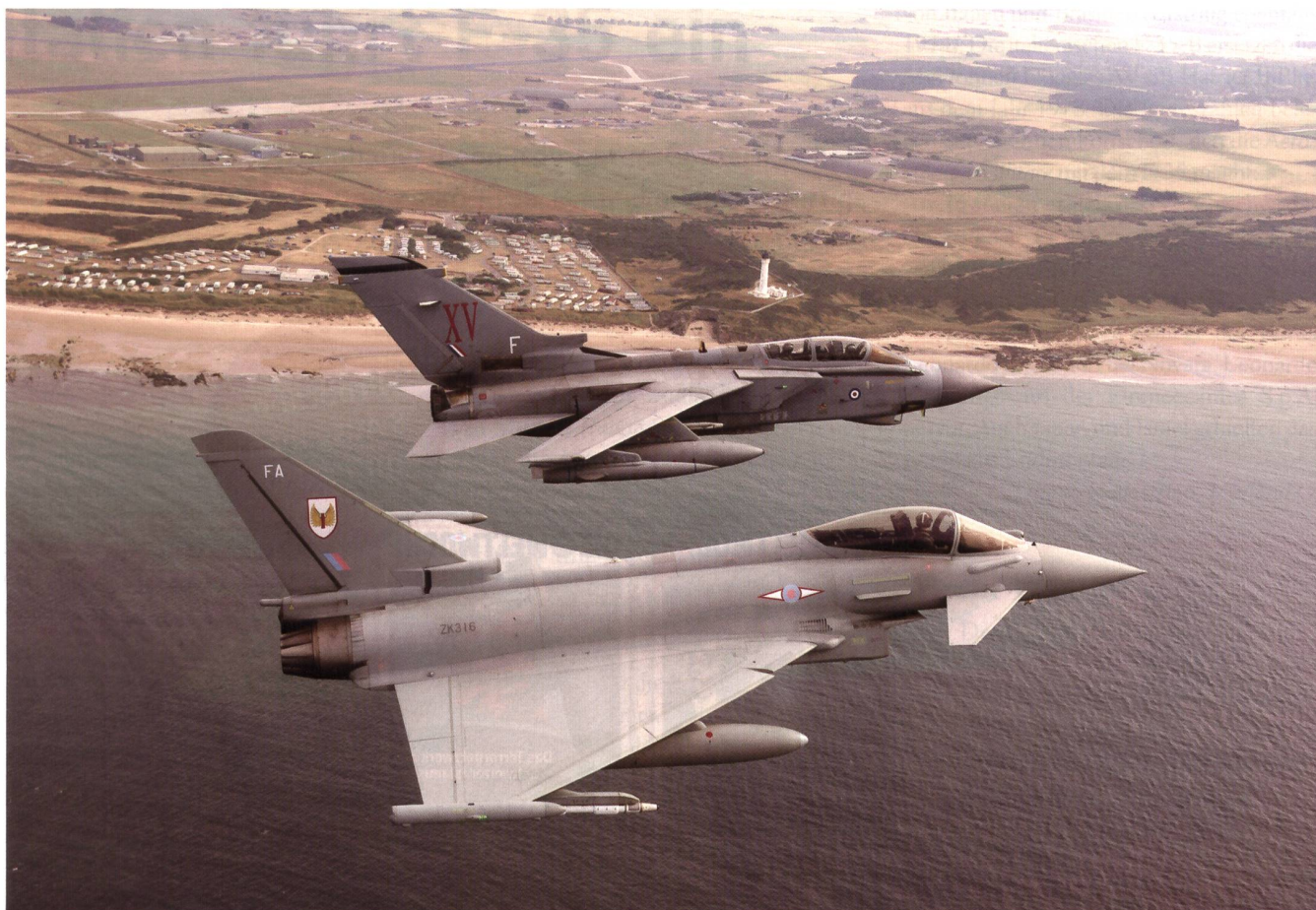
Kampffjets über Lossiemouth. Hinten der berühmte Stützpunkt der Royal Air Force.