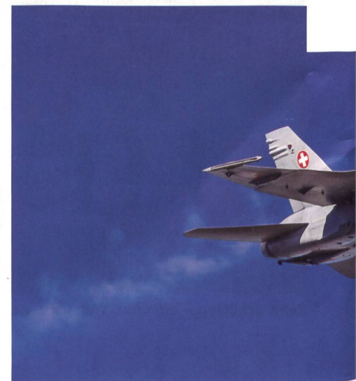
F/A-18. STBY 121.50 (mhz) = Funkfrequenz für