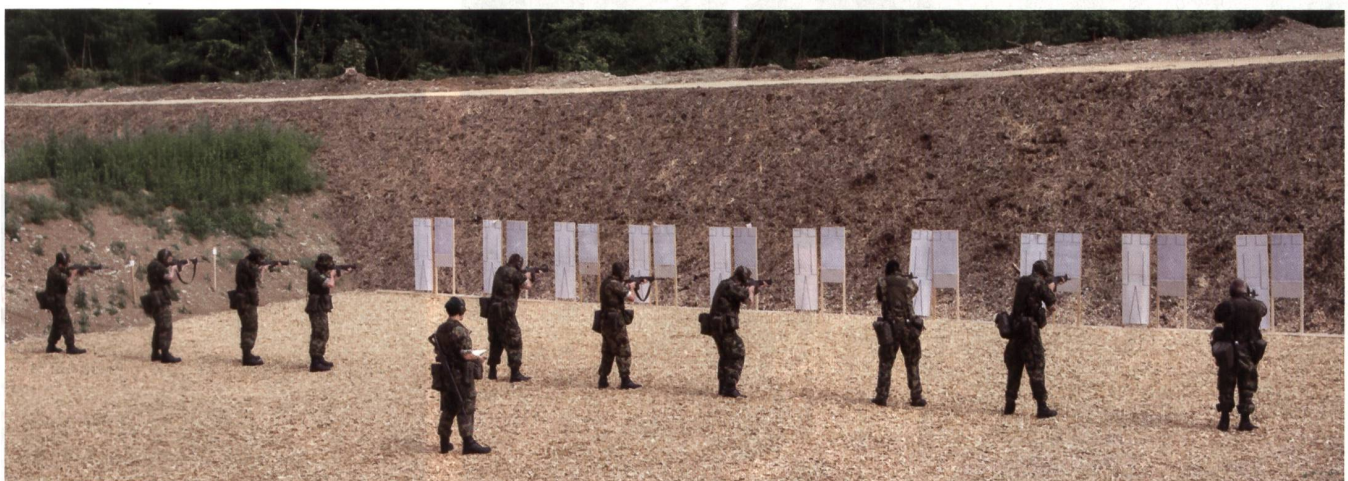
Zehn Schützen – ein Chef. Wer trifft stehend am besten?