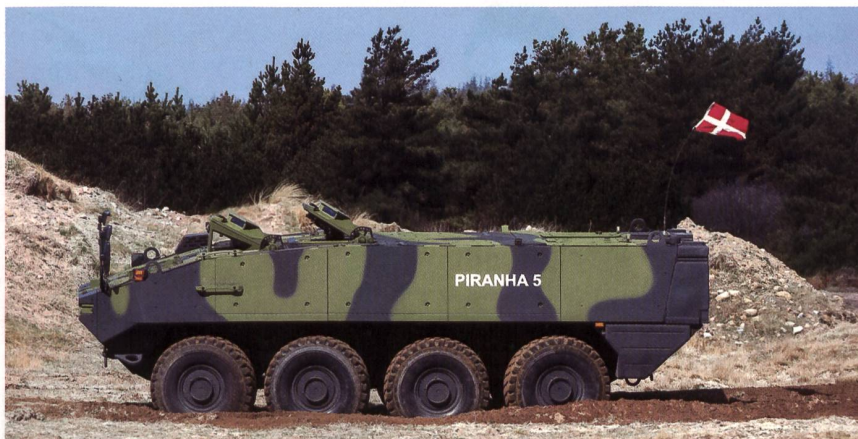
Die Schweizer Rüstungsbranche braucht den Export: Piranha-5 nach Dänemark.

weisen. Die Schweiz braucht eine eigene Rüstungsbasis. Und weil der Heimmarkt zu klein ist, dürfen die Rüstungsbetriebe gegenüber der EU-Konkurrenz nicht benachteiligt werden. fo.